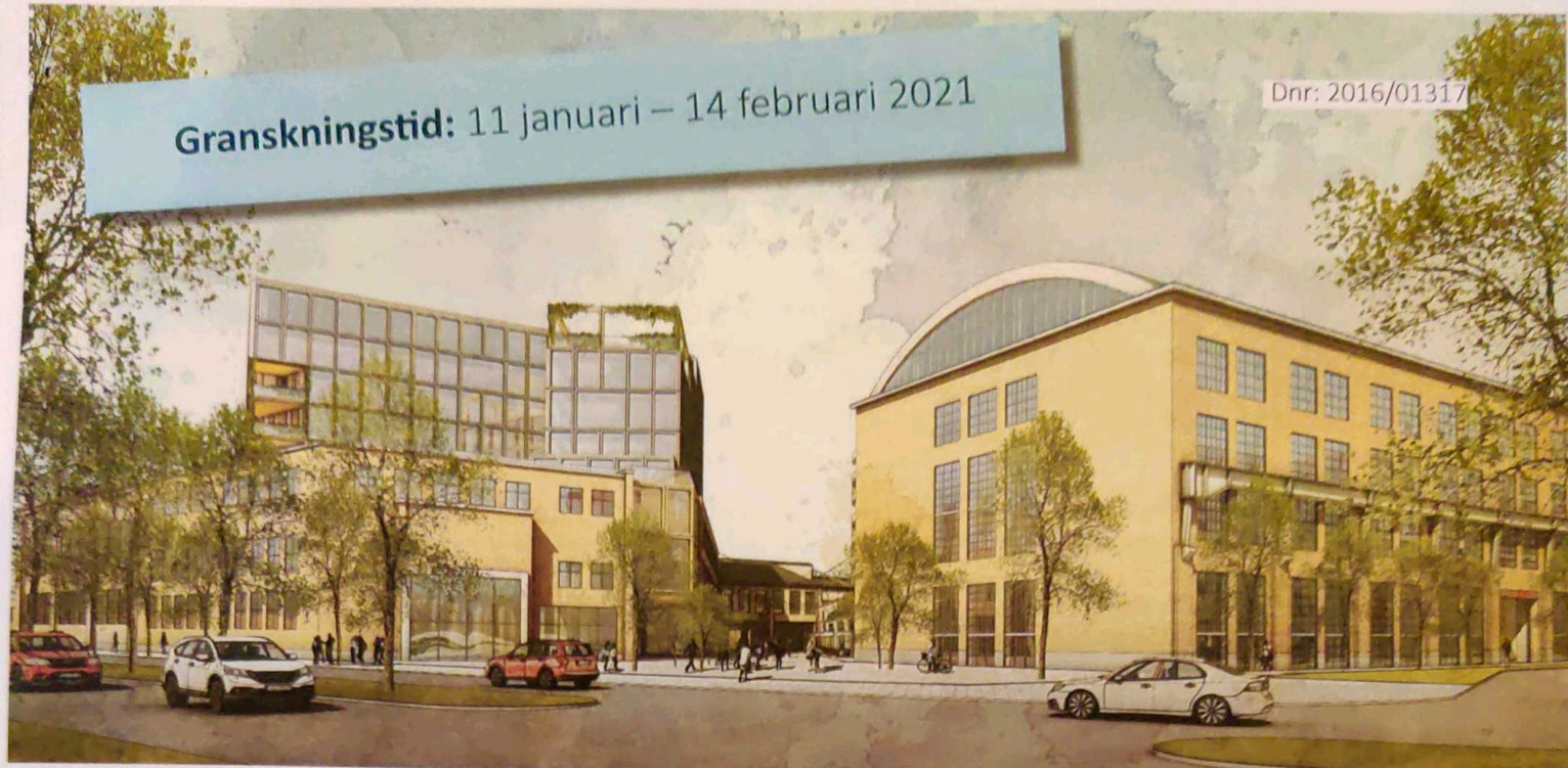
Illustrationen är ett exempel på hur området skulle kunna se ut från Östra Ringvägen. Illustration: Archus