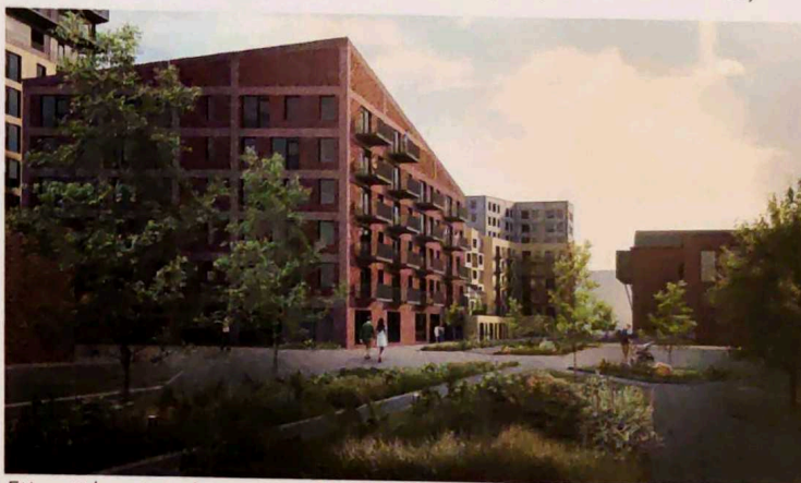
Ett nytt kvarter planeras mellan järnvägen i öst och Emausverkstaden. Ett parkstråk planeras även från södra till norra Kopparlunden (Dreem Arkitekter)