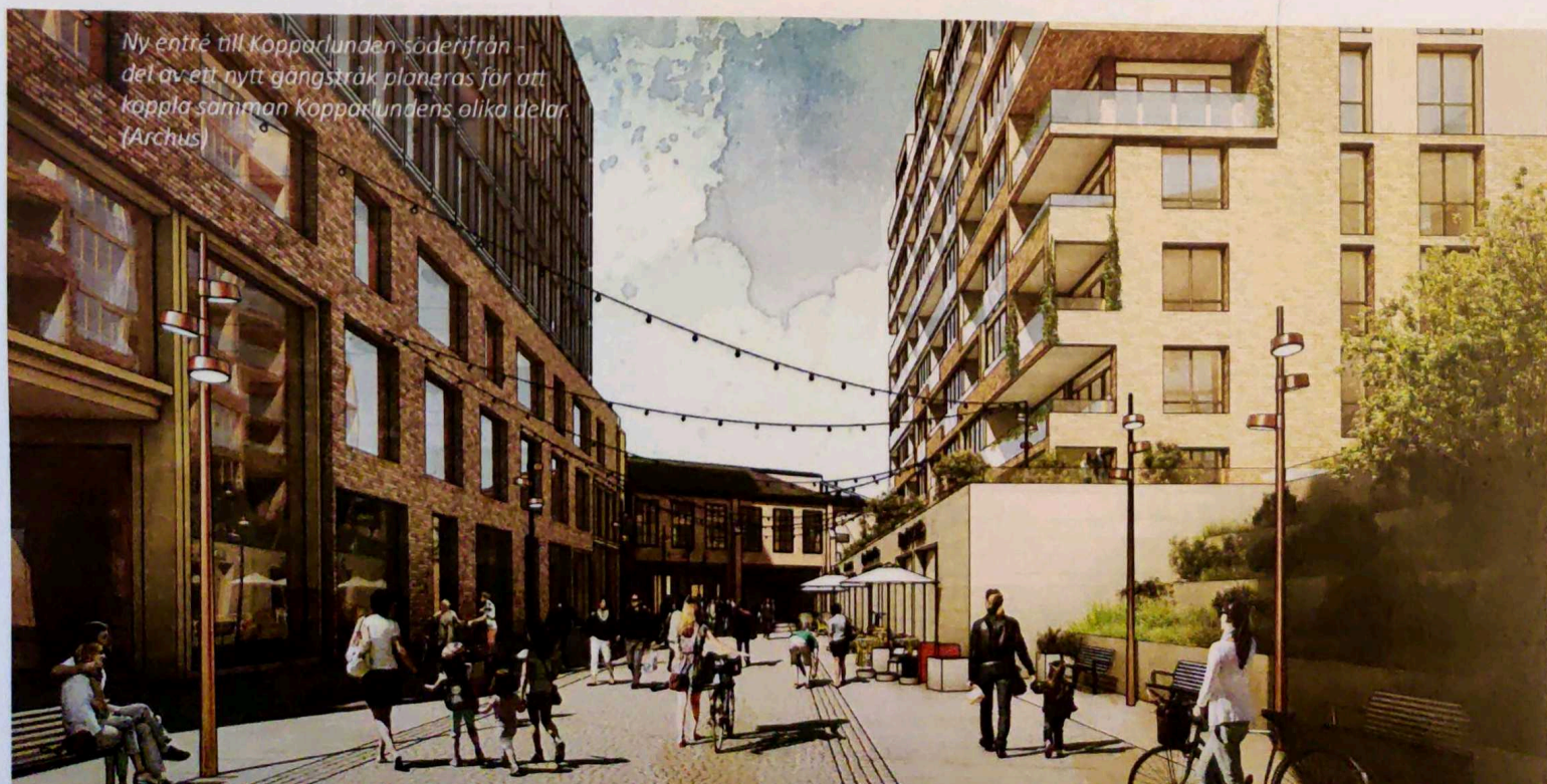
Ny entré till Kopparlunden söderifrån – del av ett nytt gångstråk planeras för att koppla samman Kopparlundens olika delar. (Archus)