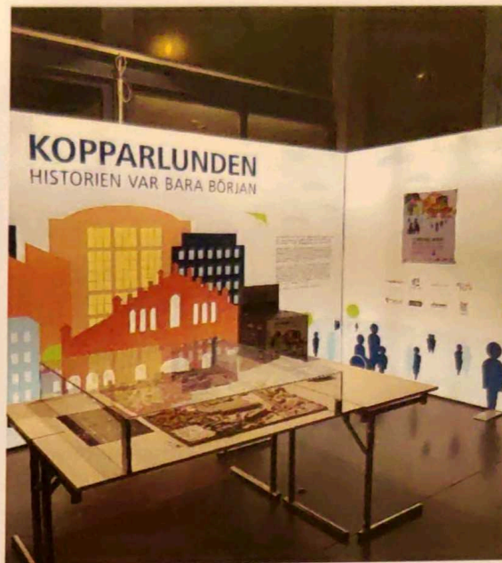
Planförslaget med fysisk modell var utställt inne på Culturen.

Under samrådstiden inkom 46 yttranden, varav 4 utan erinran.