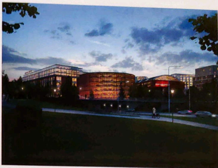
Vy från Röda Torget, öster om Kopparlunden. Nytt parkeringshus planeras mellan Arvidverkstaden och järnvägen. (Ahrbom & Partner)

Gå in på vasteras.se/kopparlunden för att få mer information om vilka ändringar som vi har gjort för Detaljplan Syd. Där finns bland annat ett bildspel där vi presenterar ändringarna. Informationen finns även i samrådsredogörelsen .